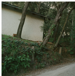
Senderes cautives, 2023 Elisenda Ribes