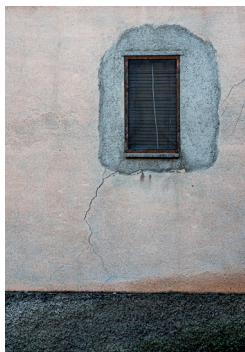
Finestra amb perruca, 2020 Mireia Margenat