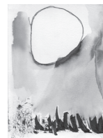
Sense títol, Tècnica mixta, 2020

D'altra banda, mai ha deixat la creació artística en la vessant d'obra gràfica, combinant aquests dos camps amb la docència. Actualment és professora del batxillerat artístic de l'Institut Baix Montseny, a Sant Celoni.