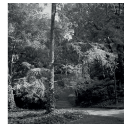
Jardins i parcs, 2011

Fotògrafa del silenci i els espais, transmet els sentiments que ens traspassen. La seva obra està fotografiada majoritàriament en pel·lícula analògica on cada imatge requereix una dedicació singular en la seva captura, revelatge i positivació. Des dels inicis als seus estudis de Belles Arts, l'Elisenda Ribes s'especialitzà en tot el procés manual del blanc i negre i és ara, en els darrers mesos, que s'ha endinsat a la màgia del color. Nascuda a Barcelona el 1976, actualment viu a Llinars i treballa en la docència.