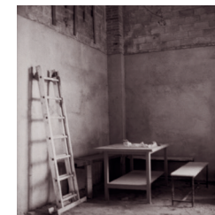
Masia al Prat de Llobregat, 2011