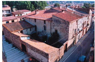
Vista del casal des del campanar