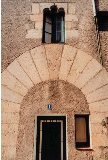
Antic portal principal de l'edifici