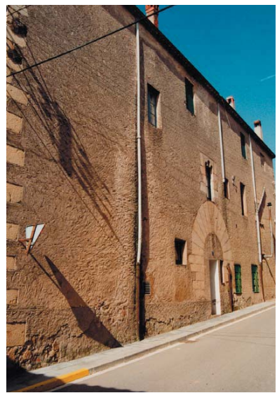
Façana del casal al carrer de Riells