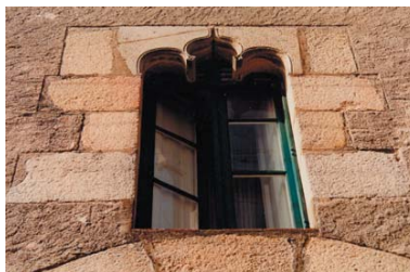
Finestral gòtic, fet de granit