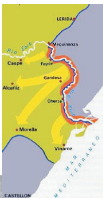
Plantejament de l'ofensiva de l'Ebre de finals de juliol de 1938

Els èxits inicials de les forces republicanes són contrarestats per una ofensiva massiva de l'exèrcit franquista. Els republicans queden atrapats entre el riu i l'enemic, s'atrinxeren i resisteixen en una dura batalla de desgast. Els combats són acarnissats a la serres de Pàndols i Cavalls. Milers de joves mobilitzats en les darreres llesves hi moren. La retirada republicana, al novembre, posa fi a la batalla.