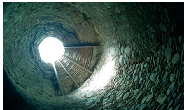
Cúpula interior de la torre