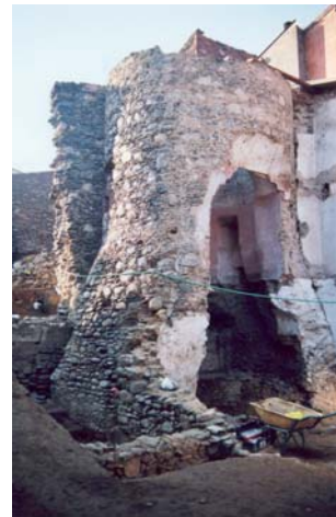
Evolució de les obres