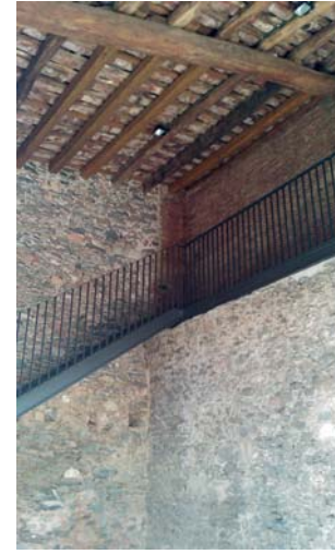
Escala d'accés a dalt de la torre