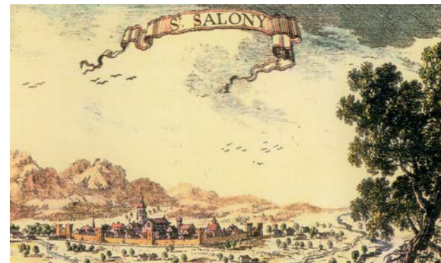
Visió idealitzada de la vila emmurallada. Gravat francès del segle XVII

Després d'aquestes vicissituds, el recinte emmurallat de Sant Celoni es conserva parcialment com a paret mitgera entre les cases del carrer Major i les dels carrers de les Valls i de Sant Roc, i com a façana d'algunes cases de la plaça del Bestiar. De les cinc torres que, com a mínim, tenia originalment el conjunt només se'n conserven dues i l'angle d'una tercera. Entre les dues primeres destaca la torre anomenada de ca l'Aymar, que és perfectament visible des de la plaça de Josep Alfaras. La torre que hi ha al carrer de les Valls és la que s'ha restaurat el 2009.