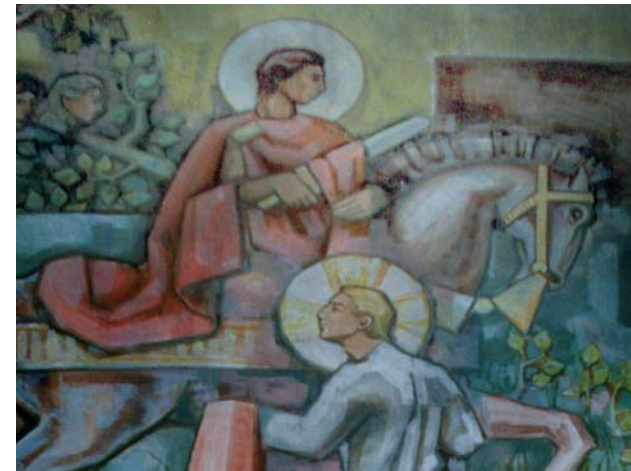
Peintures de l'autel principal