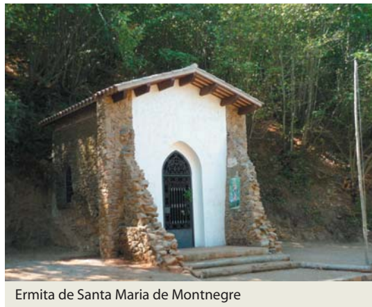
Ermita de Santa Maria de Montnegre

L'itinerari és senyalitzat com a sender local (blanc sobre verd, SL-C103) en fites de fusta, i al llarg del camí es troben plafons informatius sobre la roureda i els faigs d'en Preses, les avellanoses i les bagues de castanyers. S'ha editat un desplegable que, a més de descriure el recorregut, ens capbussa en detalls que podem observar tot caminant i que ens permet comprendre més enllà del que veiem, tal com ho fan també els plafons informatius.