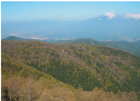
Roureda culminal, i al fons Sant Celoni i el Montseny

Es tracta d'una excursió llarga però atractiva per camins, corriols i pistes, que ens permet conèixer les zones més elevades del Montnegre, les seves característiques geològiques i biològiques i la història de les activitats humanes.