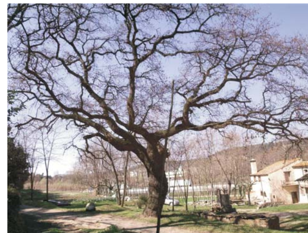
Quercus pubescens L. Roure martinenc Altitud: 115 m

És un dels roures més grans del municipi de Sant Celoni i havia estat encara més gran abans que se li trenqués una de les branques principals, que va caure sobre l'era en temps d'abandonament de l'activitat al molí, després de la Guerra Civil. Sobre la ferida se li van apilonar canyes durant molts anys, cosa que li va produir greus putrefaccions i forats a la fusta fets per escarabats barrinadors.