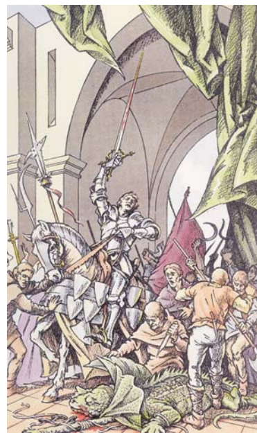
Entrada triomfal d'en Soler de Vilardell a la Força de Sant Celoni després de matar el drac. Gravet acolorit de Marià Vigas, cap a 1965

Aquest recorregut ens portarà a la roca del Drac, un aflorament de quars on la llegenda del Soler de Vilardell situa el cau del drac ferotge, i a l'església de Sant Llorenç de Vilardell. La passejada permet descobrir els diferents matisos del paisatge rural, urbà i forestal, així com trobar-hi empremtes del nostre passat