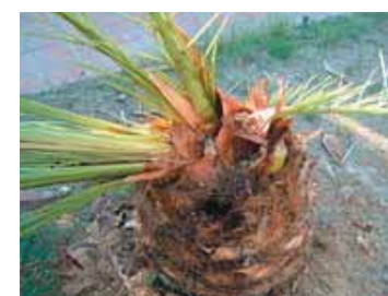
Espècie afectada pel coleòpter barrinador conegut com el morrut de les palmeres