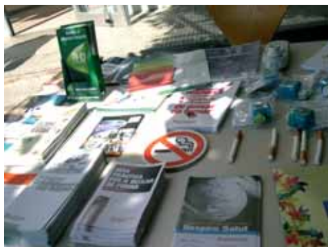
Els taller tenen com a objectiu educar en estils de vida saludable

L'Ajuntament de Sant Celoni organitza durant aquest trimestre diversos tallers de promoció de la salut als centres educatius del municipi amb el suport de la Diputació de Barcelona. Els tallers tenen com a objectiu educar estils de vida saludable en la comunitat escolar des de diversos eixos: sexualitat,