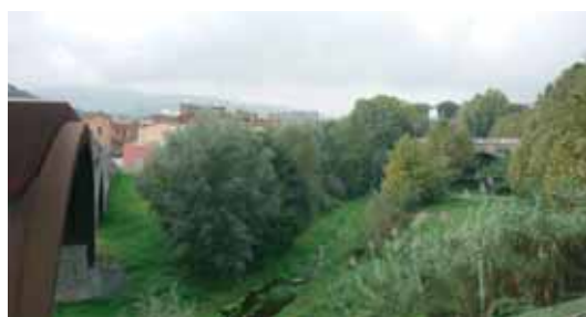
El bosc de ribera entre el Pont trencat i el pont de la carretera C-35

Sortim del Pont Trencat, al marge esquerre de la Tordera (els marges d'un riu sempre s'ubiquen segons la direcció de l'aigua: si ens plantem al mig del Pont Trencat i mirem aigües avall, el marge esquerre de la Tordera és el que ens queda a la nostra esquerra, encara que després ens dirigim aigües amunt). Des del pont hi ha una bona vista del riu, i podem observar pollancre, verns, salzes, plàtans... com comencen a perdre la fulla. Si tenim paciència podem veure grups de barbs de muntanya moure's de pressa per dins el riu. Entre aquest pont i el de baix, el Pont de la Sila (també anomenat de la Cantina o de la Reina), s'hi veuen famílies d'ànecs collverd, i a la primavera el blauet pescar.