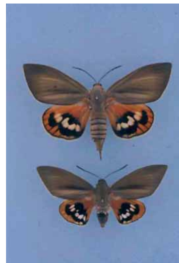
Eruga barrinadora (papallona)

Més informació sobre les plagues a: www.ruralcat.net