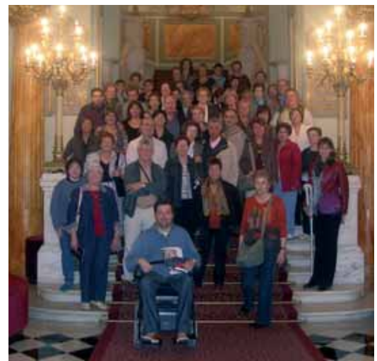
El grup a l'escala principal on va començar la visita

60 persones van participar a la sortida cultural al Gran Teatre del Liceu que es va fer dissabte 11 d'octubre organitzada per l'Ajuntament. Situat a la Rambla de Barcelona, el Liceu és un dels teatres més solemnes de l'arquitectura europea del XIX i un dels teatres d'òpera més grans del món. El recorregut de la visita va començar a l'entrada principal, amb la gran escala d'accés al primer pis. Es va visitar la Saló dels Miralls, el Foyer que està situat sota la platea actual i el Cercle del Liceu, un club privat vinculat al teatre que té les sales decorades a l'època del Modernisme i conserva una interessant col·lecció de pintura catalana de l'època, especialment de Ramon Casas.