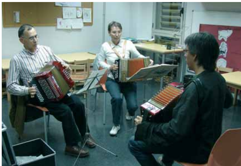
Els alumnes d'acordió diatònic aprenen a tocar melodies tradicionals

Durant el mes d'octubre han començat dos nous cursos al Centre Municipal d'Expressió: el Txi Kung i d'acordió diatònic. Imitant la natura i els animals, en el curs de Txi Kung, una quinzena de persones fan moviments basats en conceptes de medicina tradicional xinesa per millorar la flexibilitat, la sensibilitat i la vitalitat. Al curs d'acordió diatònic, els alumnes assisteixen a una classe compartida de 60 minuts, al llarg dels quals aprenen a tocar melodies tradicionals i els seus acompanyaments.