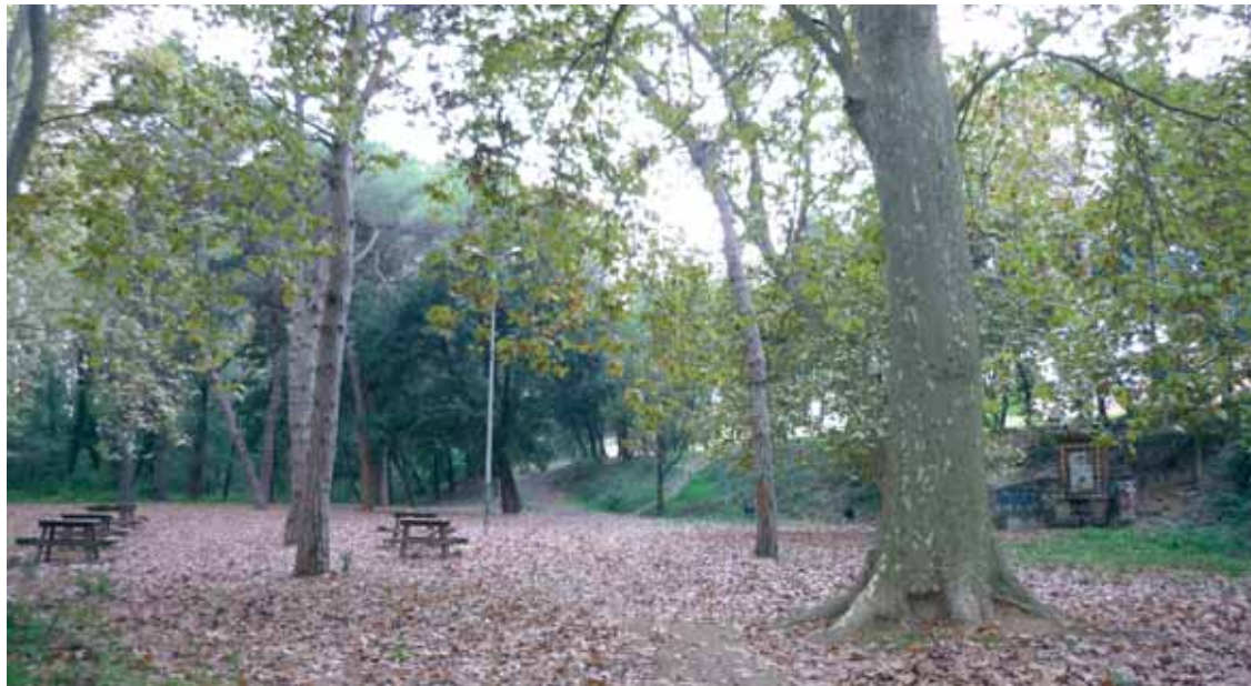
El pla de la font dels Enamorats

Aquest passeig ens porta a conèixer una zona periurbana de Sant Celoni i a contemplar la tardor prop de la ribera de la Tordera. Si som bons observadors, a més, podrem fixar-nos en cadascun dels ponts que travessen el riu.