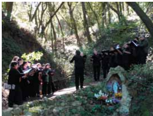
La coral Briançó va acompanyar el recital de poesia al sotabosc de la font