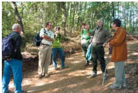
La passejada va servir per inaugurar un nou sender local per la carena i la baga del Montnegre

Dissabte, 4 d'octubre, es va organitzar una sortida per recórrer el sender local per la carena i la baga del Montnegre, que l'Ajuntament de Sant Celoni, juntament amb el Parc del Montnegre Corredor, preveu senyalitzar durant la primavera vinent. La sortida va permetre posar en comú els diferents elements d'interès de l'itinerari, i gaudir del bosc i les panoràmiques de tardor. Aquesta excursió es va fer en el marc de la 3a Setmana de Custòdia del Territori, que té com a objectiu difondre a la ciutadania la filosofia de gestió sostenible del territori i de responsabilitat de propietaris i usuaris en la conservació i bon ús de la terra i dels seus valors naturals, culturals i paisatgístics.