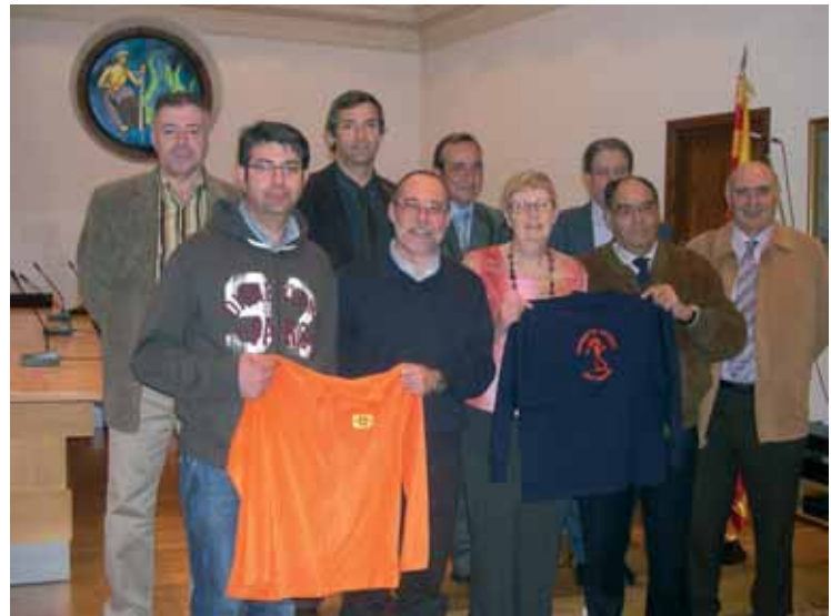
Les tres empreses que han acceptat patrocinar l'expedició a proposta de l'Ajuntament van fer efectiva la seva aportació a representants del Club Patí en un acte el passat 30 d'octubre