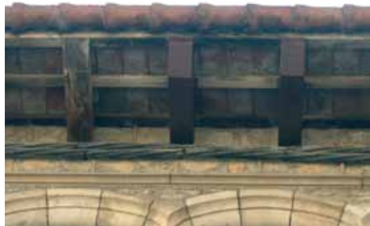
Voladís de fusta arranjat

Can Ramis ja té arreglat el voladís de fusta que es va cremar fortuïtament durant la Festa Major de setembre. Sortosament el dany va ser lleu i la intervenció que s'ha dut a terme no ha implicat gran complexitat.