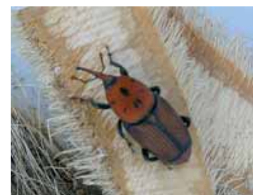
Morrut de la palmera (escarabat)