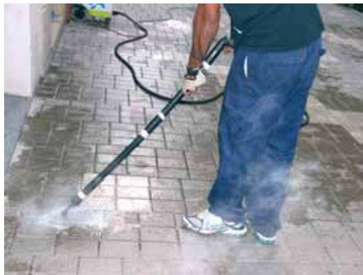
Una empresa especialitzada ha treballat amb vapor a baixa pressió i detergent

Durant el mes d'octubre s'ha dut a terme la neteja de xiclets enganxats al carrer Major i a la plaça de l'Església. Una empresa especialitzada ha treballat amb vapor a baixa pressió i detergent per treure la gran quantitat de xiclets que hi havia enganxats al terra. A més de la mala imatge que suposen, els xiclets converteixen el paviment en una massa enganxosa. El sistema habitual de neteja viària no aconsegueix treure aquesta brutícia i per això ha calgut contractar una empresa especialitzada.