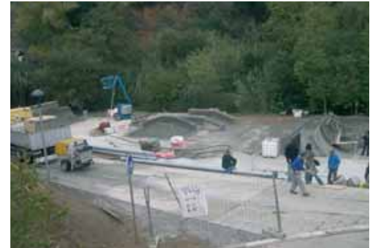
A més d'una grada i un petit escenari el parc té zona de patinatge i zona d'escalada