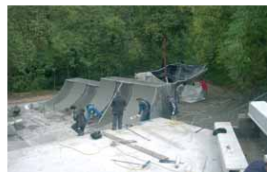
La zona dels patinadors tindrà diferents estructures