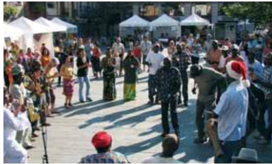
Durant tot el dia es van fer activitats complementàries