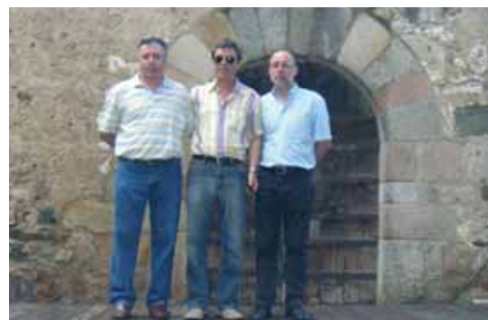
Club Futbol Sala Sant Celoni sènior masculí: ascens a la categoria territorial catalana