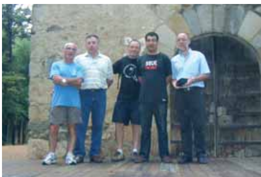
Club Amics Tennis Taula sènior masculí A: campions de 1era territorial i ascens a preferent