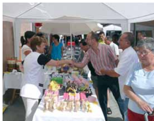
Durant tot el dia el carrer d'Anselm Clavé va estar molt concorregut

La vuitena edició del Mercat de la Ganga, que va organitzar l'Associació de comerciants del carrer Anselm Clavé el dissabte 4 de juliol, va ser un èxit de participació. Durant tot el dia, nombroses persones es van acostar al carrer Anselm Clavé per conèixer les ofertes que els botiguers realitzaven i poder adquirir productes a preus molt rebaxats. La jornada va finalitzar amb un sopar al que van assistir els comerciants del carrer i que va comptar amb la presència dels regidors de Desenvolupament i d'Espai Públic.