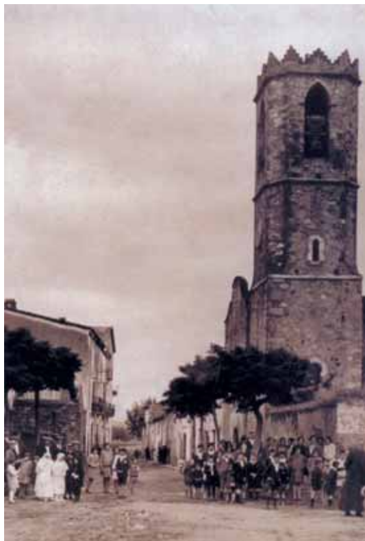
La Batllòria cap a 1930

Des de l'època medieval, el territori que ara coneixem com la Batllòria formava part del terme del castell de Montnegre. El 22 d'abril de 1274 Ponç de Gualba va comprar el castell i les seves terres a l'infant Pere, primogènit de Jaume I el Conqueridor. D'aquesta manera els Gualba passaren a ser senyors del castell de Montnegre, que aleshores estava integrat per dues parròquies. La principal, situada a prop del castell, era Sant Martí de Montnegre, i Sant Cebrià de Fuirosos, que comprenia el futur nucli de la Batllòria, era la sufragània. Justament el camí ral, que era una via molt transitada perquè unia Barcelona i Girona seguint el traçat