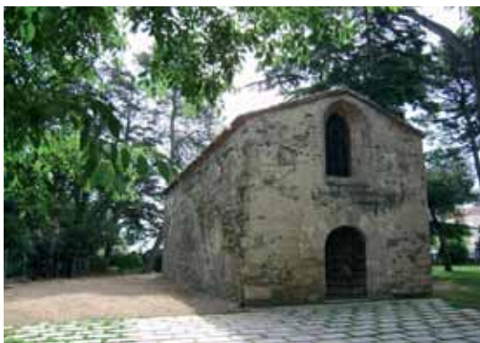
El lateral s'ha cobert amb sorra i torna a estar transitable sense condicionar futures actuacions

L'entorn de l'església de Sant Martí de Pertegàs, a la Rectoria Vella, s'ha cobert amb sorra i torna a estar transitable. Fa temps es varen completar els treballs d'estudi de l'entorn arqueològic de l'església de Sant Martí de Pertegàs, al parc de la Rectoria Vella. Amb totes les restes ben documentades, i després de valorar diverses opcions de tractament de l'espai, s'ha optat per l'actuació més senzilla, consistent en la col·locació de làmina geotèxtil de protecció amb sorra al damunt. D'aquesta manera torna a estar transitable el pas al voltant de l'edifici i, alhora, no es condicionen futures actuacions.