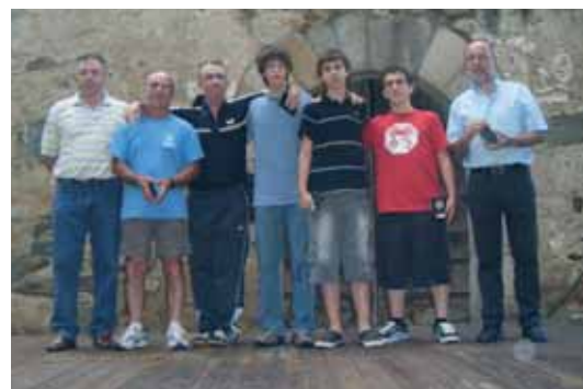
Club Amics Tennis Taula sènior masculí B: ascens a 1era territorial