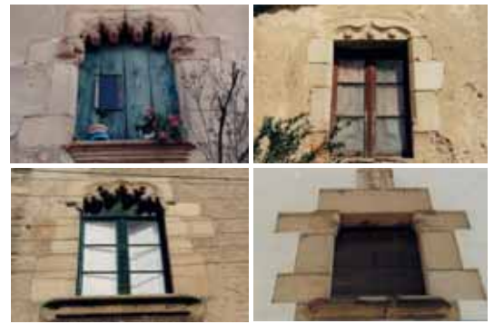
Alguns finestrals de tradició gòtica

les finestres lobulades de tradició gòtica, moltes de les quals estan decorades amb carasses. Al fogatge de 1553 hi consta un altre mestre de cases, Jaume Camps i un "Ranon Françes" que viu al mateix edifici. Aquest darrer devia tenir el mateix ofici i sembla originari del país veí.