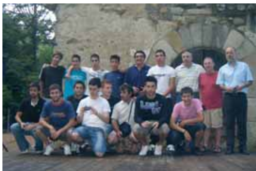
Club Esportiu Sant Celoni: Juvenil - campions de 2ona divisió i ascens a 1era divisió