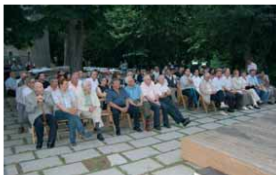
Una seixantena de regidors i regidores i molts familiars van assistir a l'acte als jardins de la Rectoria Vella