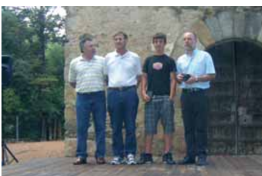
Penya Barcelonista de Sant Celoni, benjamí A: campions de 1era divisió i ascens a preferent