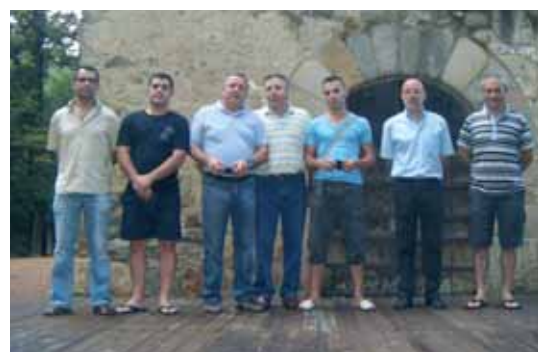
Penya Barcelonista de Sant Celoni, Cadet: campions de 2ona divisió i ascens a 1era divisió