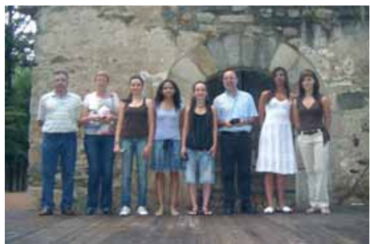
Club Patí Sant Celoni, secció patinatge artístic: campiones de Barcelona, Catalunya, Espanya i Europa en modalitat xou conjunts grups petits

Una forta tamborinada estiuenca que va tenir lloc estones abans de l'acte, no va impedir que el passat 19 de juny Pòdium 2009 s'estrenés com a nou esdeveniment esportiu de Sant Celoni. Més de 170 esportistes del municipi, acompanyats dels responsables de les entitats, i molts familiars es varen aplegar als jardins de la Rectoria Vella, per compartir els èxits de la temporada esportiva 2008-2009. L'alcalde Francesc Deulofeu i el regidor d'Esports Miquel Negre van lliurar un petit obsequi als esportistes celonins. Moltes felicitats!