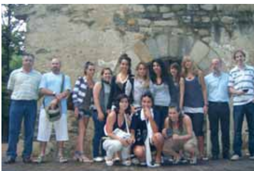
Club Bàsquet Sant Celoni cadet femení: campiones de lliga