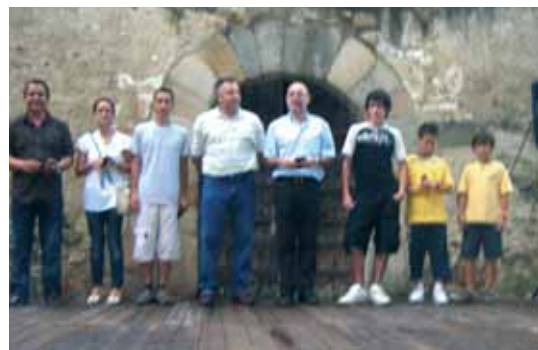
Club Atletisme Sant Celoni modalitat individual: atletes de diverses categories han aconseguit pòdium al Campionat de Catalunya i d'Espanya