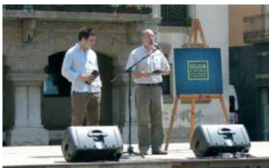
L'alcalde i el regidor de Cultura van presentar la Guia d'entitats