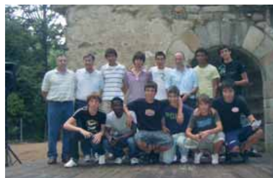
Club Esportiu Sant Celoni, 1er equip: campions de 2ona territorial i ascens a 1era territorial