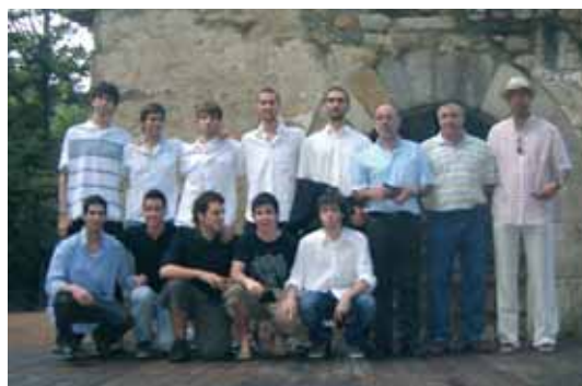
Club Bàsquet Sant Celoni sub -21 masculí: campions territorials Barcelona sub-21 nivell A2