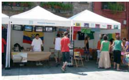
Cada entitat disposava de la seva carpa al llarg del carrer Major