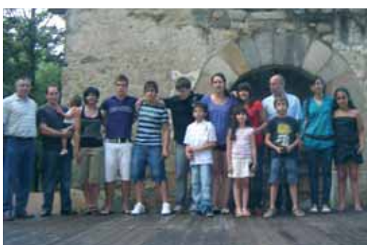
Karate Club Just modalitat individual: karateques de totes les categories han pujat al pòdium del Campionat de Catalunya