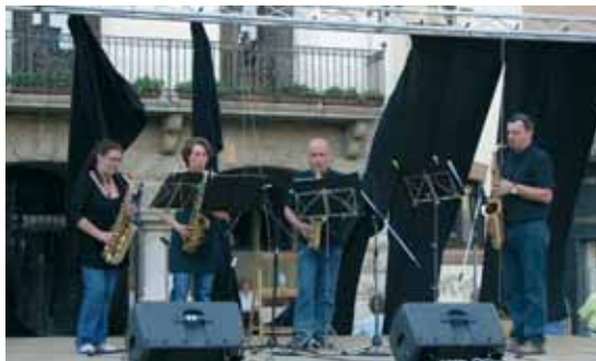
El Quartet de Saxos del CME també es va afegir a la festa