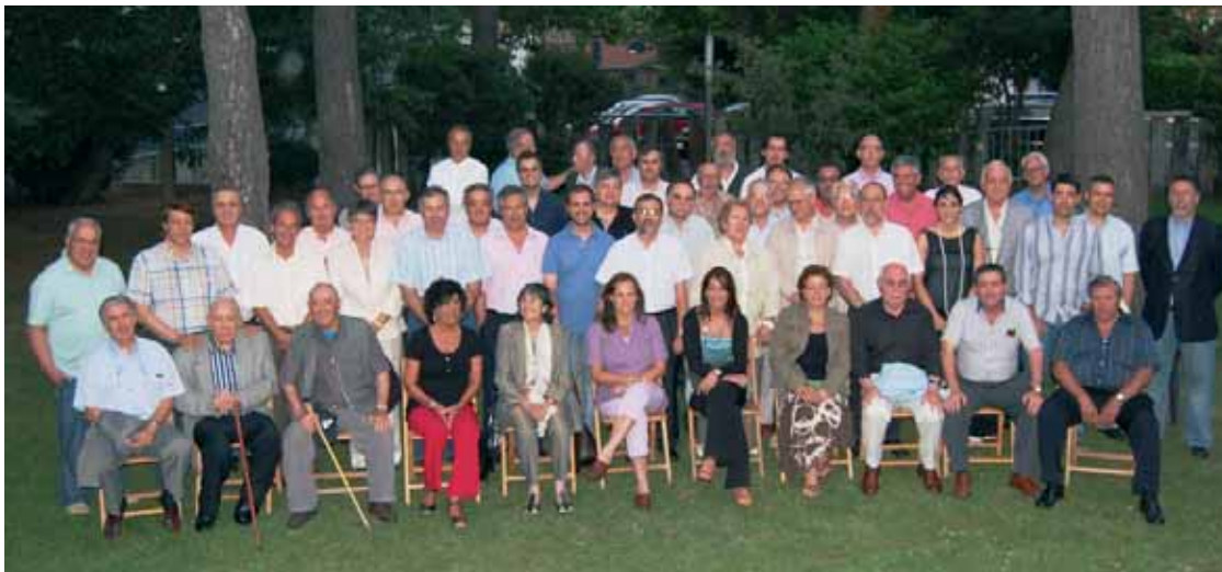
Foto de família dels regidors i regidores de tots els consistoris del 1979 a l'actualitat