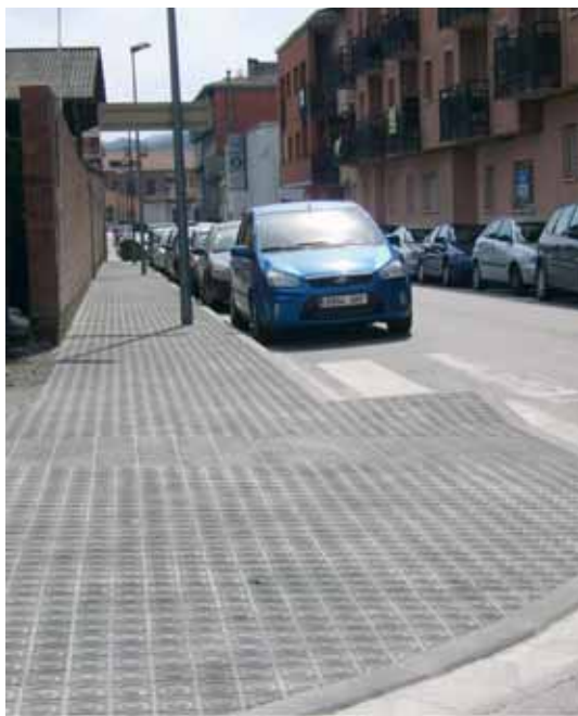
Carrer Palautordera entre Doctor Barri i Vallès

La vorera estreta i sense panots del carrer Palautordera, entre Doctor Barri i Vallès, ha canviat completament la fisonomia. Ara permet el pas còmode, ample i accessible gràcies als nous baixadors dels extrems. Durant el mes de juny també s'ha iniciat el tractament de les cantonades del carrer de Diputació, entre Ramon y Cajal i Verge de Puig, on es preveu, a més, la generació de noves travesseres per a vianants i la rehabilitació completa de la vorera de ponent, entre Avinguda de la Pau i Ramon y Cajal.