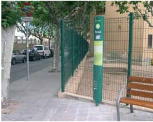
Les 21 parades disposen d'aquest element informatiu amb el plànol i els horaris del bus

Des del 29 de juny, el bus urbà circula per un nou itinerari, amb noves parades, que li permet tenir una freqüència de pas de 30 minuts. Uns nous pals verds identifiquen millor les parades i permeten una millor lectura dels horaris.