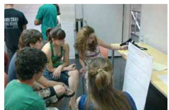
Les conclusions del document s'han aconseguit després de 6 mesos de treball amb entitats, equipaments juvenils, tècnics, polítics i joves

Una cinquantena de persones van participar el 13 de juny a l'acte de presentació i debat de les conclusions de la diagnosi de la realitat juvenil que s'ha aconseguit després de 6 mesos de treball amb entitats, equipaments juvenils, tècnics, polítics i joves. Els resultats obtinguts posen de manifest quines són les necessitats del jovent celoní i apunten les polítiques adients per respondre a aquestes demandes i que es recolliran en el Pla local de joventut 2009-2013. Fins a finals de mes, els joves tenen temps per presentar esmenes al document.